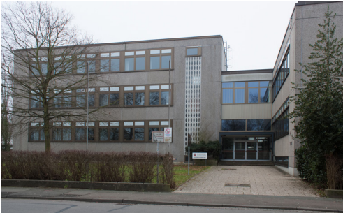
Rinteln (Kreishandelslehranstalt) Dauestraße