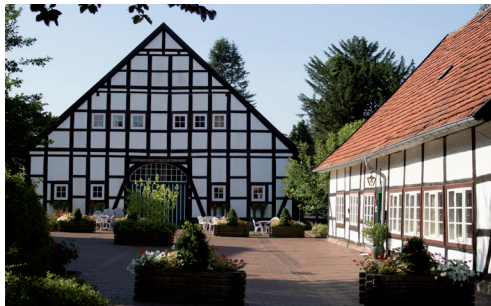
Bückeberg (Landfrauenschule) Jetenburger Straße