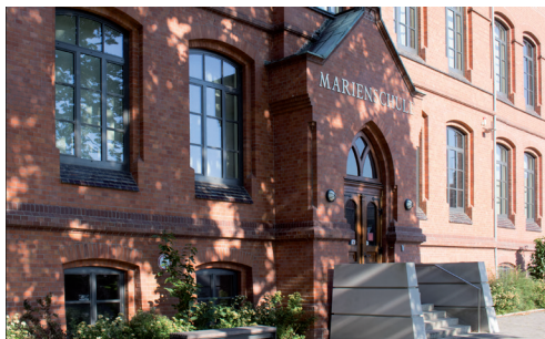
Bückeberg (Marienschule) Am Oberstenhof