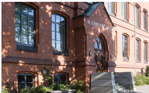
Bückeburg (Marienschule) Am Oberstenhof